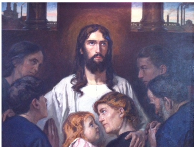
Detalj ur altartavla Vedevågs kyrka.