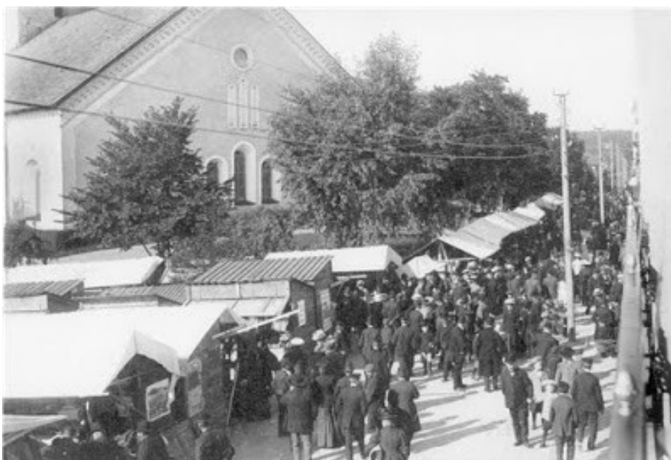
Torget i Lindsberg 1800-tal

Föreläsaren rekommenderar även att gå in på hemsidan lindehistoria.se