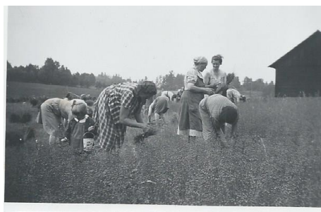
Linryckning , Lundby ca 1945, privat bild

I Dunker-Lilla Malma hembygdsförenings arkiv kopia av uppgifter ur dombok med statarkontrakt.