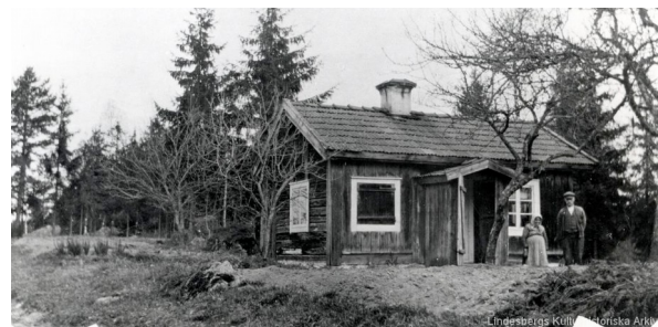
Torpstuga 1910-tal Koverboda . Lindesbergs kulturhistoriska arkiv.

Vid mitten av 1800-talet fanns det som flest torp i Sverige, ca 100.000. En femtedel av vårt lands invånare beräknas då ha bott i torp eller backstugor.