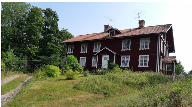
Statbyggning Dunkershall, Sörmland. 2018

Hur var då levnadsvillkoren för denna proletära underklass? Statarna var årsanställda. Många bytte ofta arbetsgivare, kanske årligen (min mormors far var ett undantag som var mer än 30 år på samma gård. (Fick Patriotiska sällskapetets medalj.) Man hoppades på en bättre tillvaro. Dessa flyttningar fick naturligtvis konsekvenser, inte minst för barnens skolgång. Flytten ägde i regel rum en grå höstdag i den s.k. friveckan med regn och blåst. Genomblöta människor och det fattiga bohaget på en skranglig hästskjuts. Förbättringen uteblev i regel.