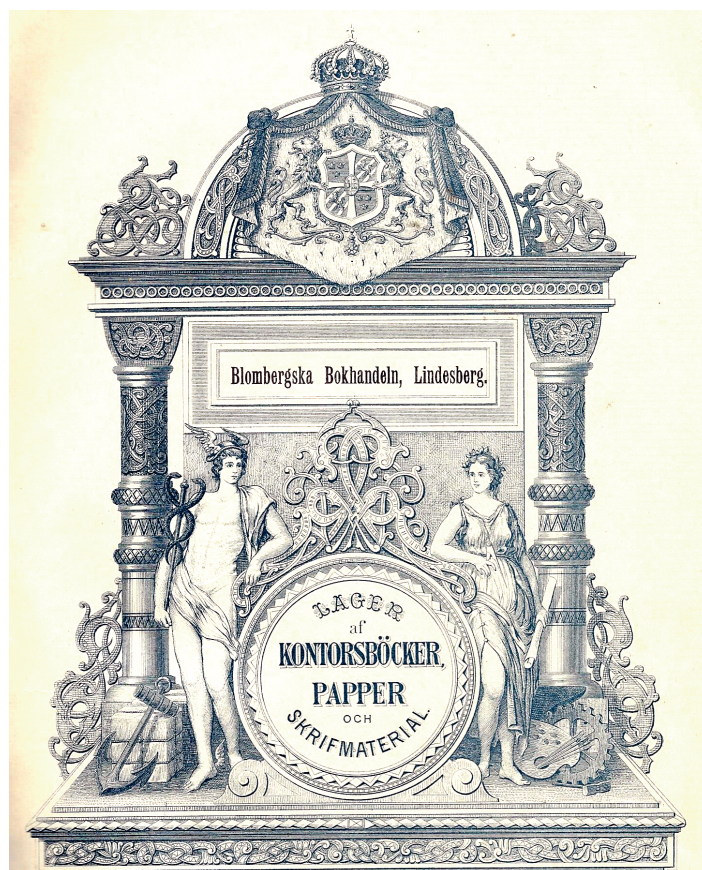
En vacker gammal protokollsbok, tryckt för Blombergiska Bokhandeln i Lindesberg.