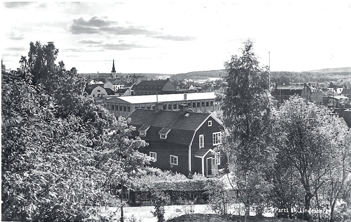
Vykort på Barnhemmet i Schröders Backe i Lindesberg. I bakgrunden Bergbolagen.

Den hade tagits i bruk i slutet av 1880-talet. Här bodde gamla, sjuka, män, kvinnor och barn med de gemensamma problemen, försörjning/omhändertagande.