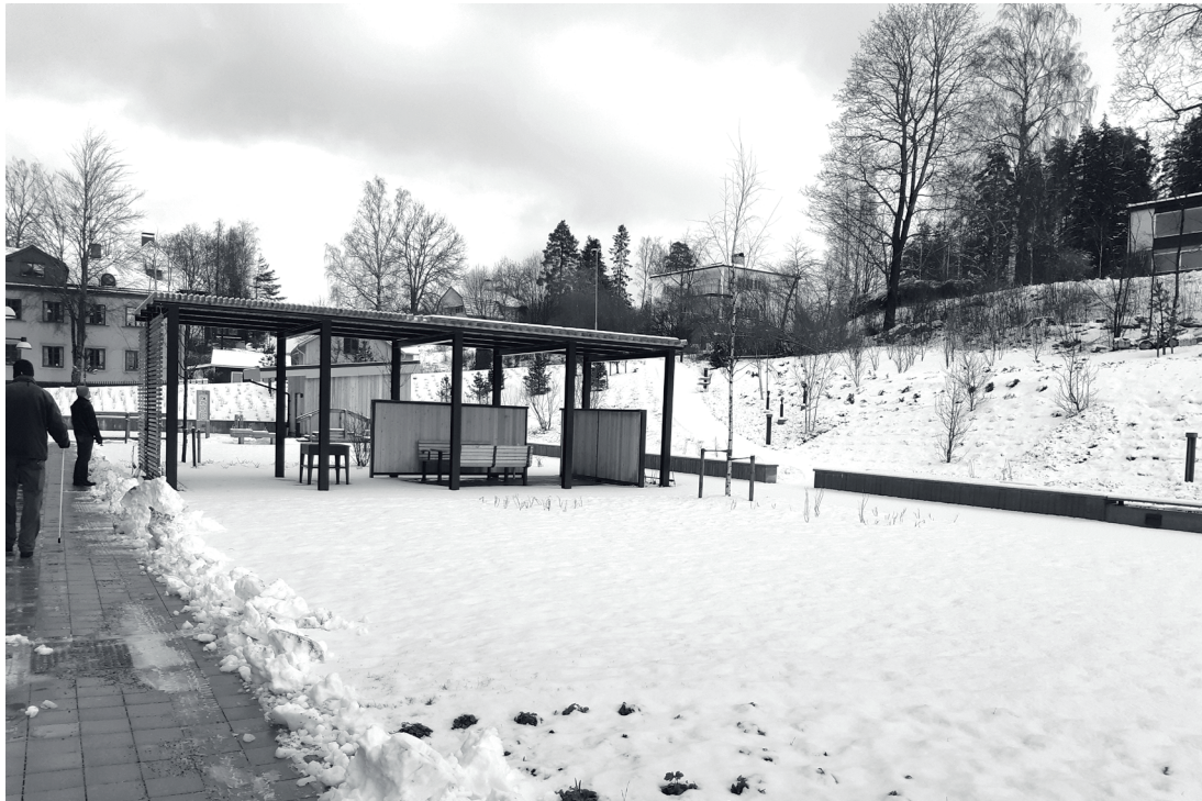
2010-talet jämnades barnhemmet med marken och januari 2020 öppnades "Bergsparken" med bland annat vårdcentral och ett antal hyreslägenheter, på samma plats.