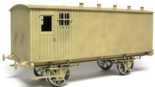
En fängstransportvagn som den kunde sett ut på 1880- talet