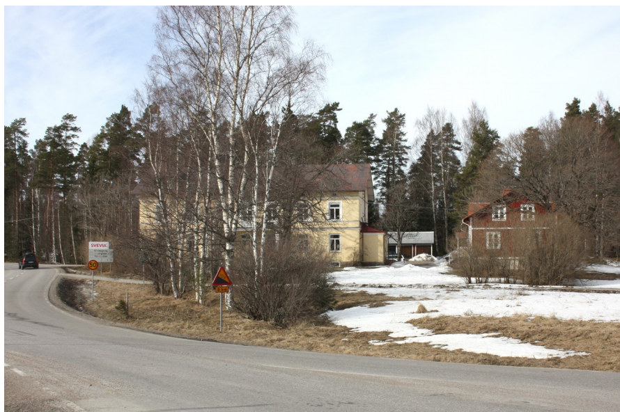
Illustration 1: Fd fattigvårdshemmet i Lindshyttan 2017