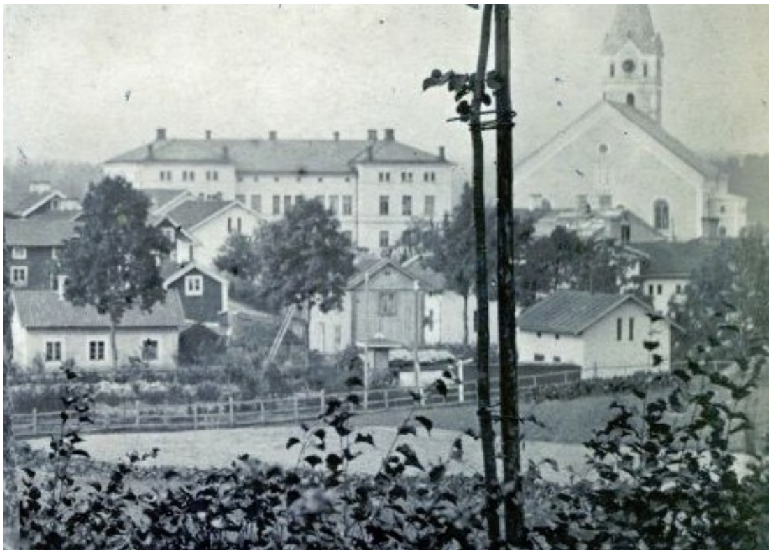
Fotografiet är taget från Bergskyrkogården efter 1876. Huset i mitten kallades för "Poliskonstapel"