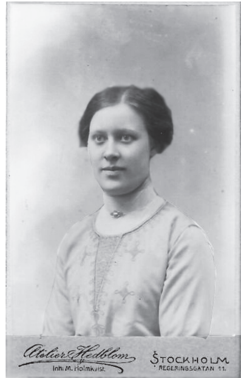
Foto ur familjealbum, brev privat